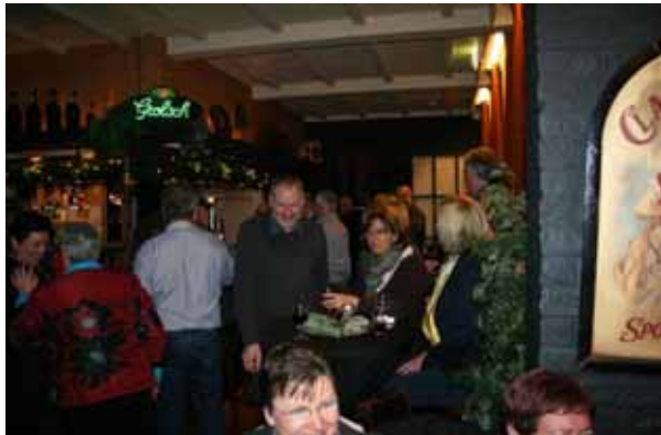
Gezellig bijkletsen en borrelen