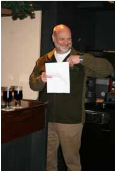
Toespraak van onze voorzitter